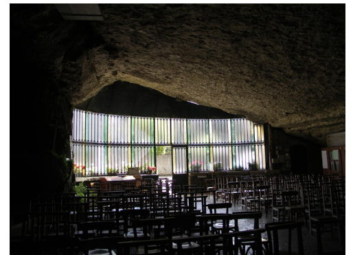
7. Rideau de verre;