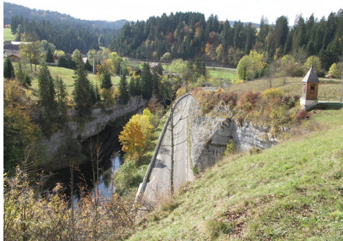
3. Clocheton sur la grotte de Remonot.

Si la Grotte du trésor est secrète, nichée dans un secteur boisé, accessible par un sentier qui