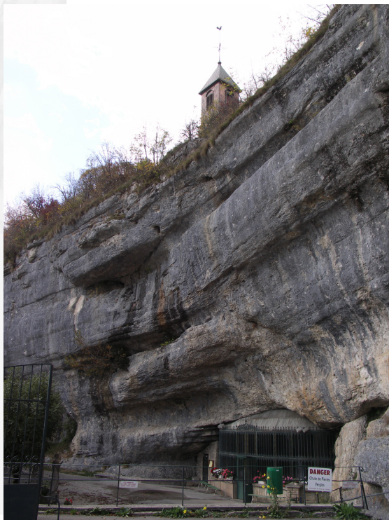
1. Notre Dame de Remonot

Préfecture de la Région de Franche Comté