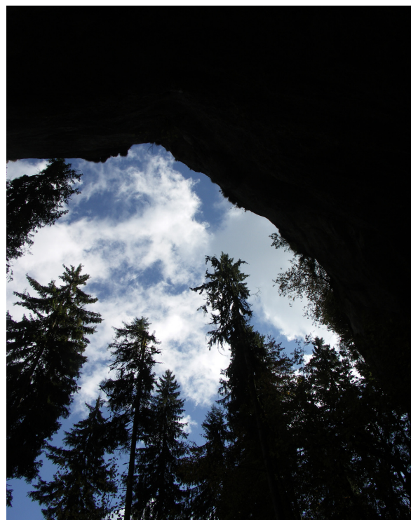
2. Grotte du trésor.