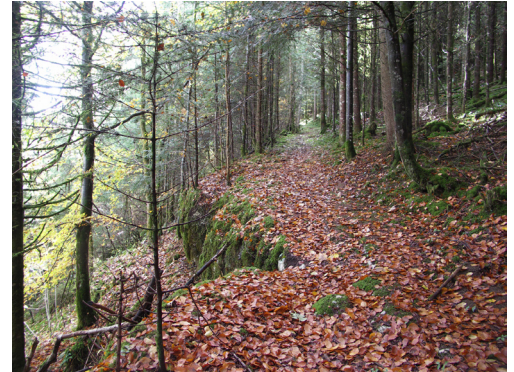
6. Sentier reliant la Grotte du trésor au Plateau

Les contraintes et facteurs de changement sont réduits pour la Grotte du Trésor mais bien présents au niveau de la grotte de Remonot : la présence du hameau ne porte pas atteinte pour l'instant au site, mais ce risque est réel. La protection de la Grotte de Remonot au titre des monuments historiques est un atout supplémentaire.