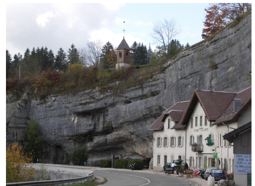
5. La grotte de Remonot : un lieu habité.

la relie au plateau des Combes, et écartée de la route ; la Grotte de Remonot quant à elle, participe à un tableau très minéral et construit : la route longe une falaise dénudée, en encorbellement où s'ouvre la grotte, elle-même fermée par un rideau de verre. L'ambiance minérale est renforcée par la présence de constructions en pied de falaise, mais aussi au dessus de celle-ci. Le clocheton de la chapelle-grotte ponctue l'ensemble. L'orientation de la voie forme dans ce secteur une large courbe qui permet une mise en scène de l'ensemble aussi bien en venant de l'amont que de l'aval