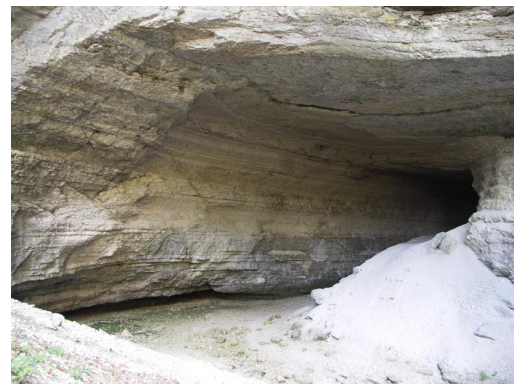
4. Ouverture de la grotte du trésor