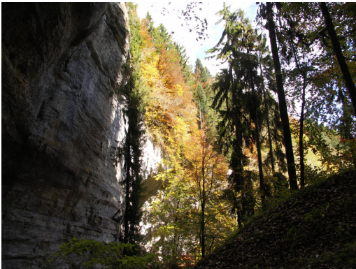
2. Arrivée à la grotte du Trésor depuis le sentier.

Ce site est constitué de deux grottes distantes l'une de l'autre de deux kilomètres. Elles sont toutes deux creusées dans les falaises de la rive gauche des gorges du Doubs. La grotte du trésor est incluse dans le site classé des gorges de Remonot.